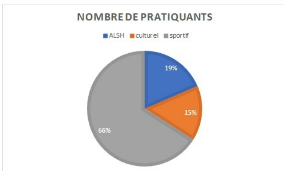
Figure 1 : proportion des adhérents et pratiquants par secteur